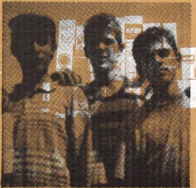
Bez naziva, 2004/2005, sito štampa na ljepenci (42x23cm)

one topološke prostore gdje se umjetnička «aura» zadobija, neosporno legitimizovani kao umjetnička djela. I mi, posmatrači, da se još jednom poslužim Grojsovim idejama, kao neka vrsta intelektualnih flanera, dakle duhovnih lutalica, dolazeći u ovakve prostore na neku vrstu poklonjenja, kroz čin «profanog prosvjetljenja» otkrivamo «auratičnost» u djelima koja u svojoj temeljnoj prirodi, poput ovih koje večeras vidimo na sjajnom Rakčevićevom FRIZU, podrazumijevaju mogućnost kopiranja i bekrajnog multiplikovanja.