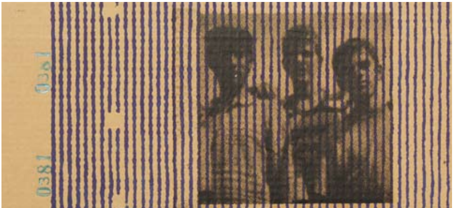
Bez naziva, 2004/2005, sito štampa na ljepenci (39x22cm)

Mislim da na taj način u datim društvenim okvirima doprinosim više nego da je moj rad usmjeren ka stvaranju "lijepe" umjetnosti.